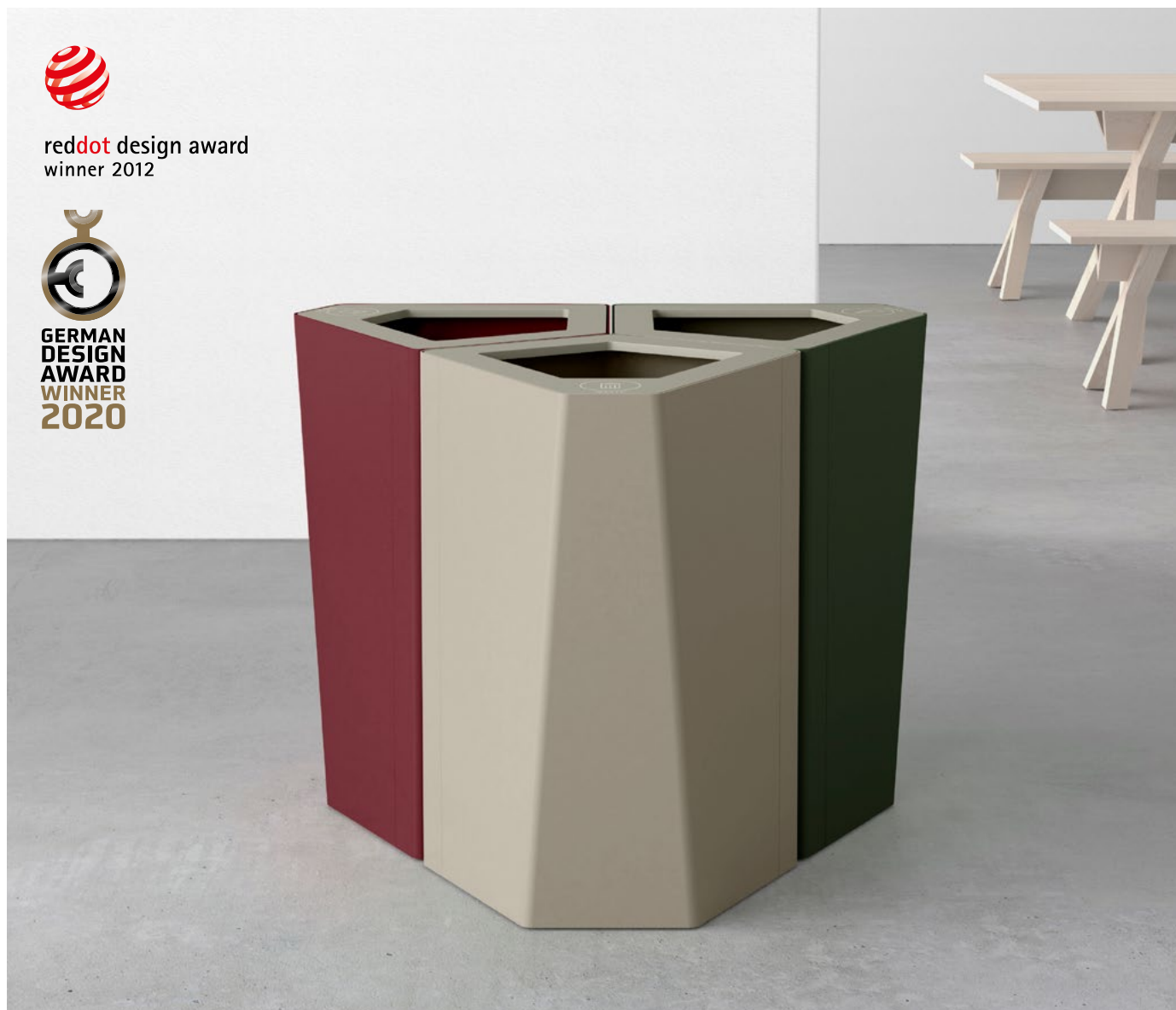
Vinröd RAL 3005 Varm grå RAL 7032 Skogsgrön RAL 6020

En modulerbar källsortering designad av Annica Doms. Belönad med Red Dot Design Award och German Design Award för sin innovativa form. Designad för moduluppbyggnad i olika konstellationer. Kite passar mot vägg eller som en fristående accent i rummet.